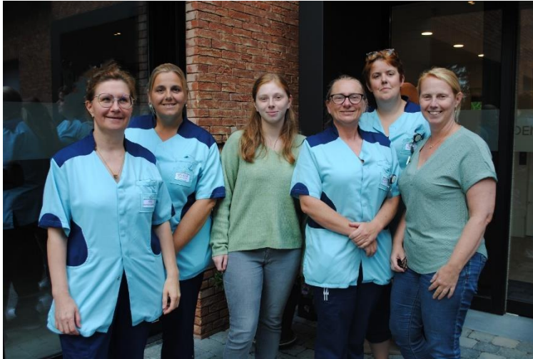
Het Palliatief Support Team